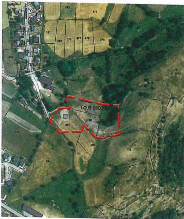
Situation du secteur 7